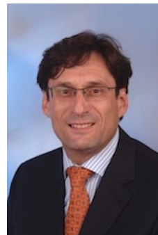
SGS Richard Klasen Governments and Institutions (GIS) SGS Germany, Hamburg